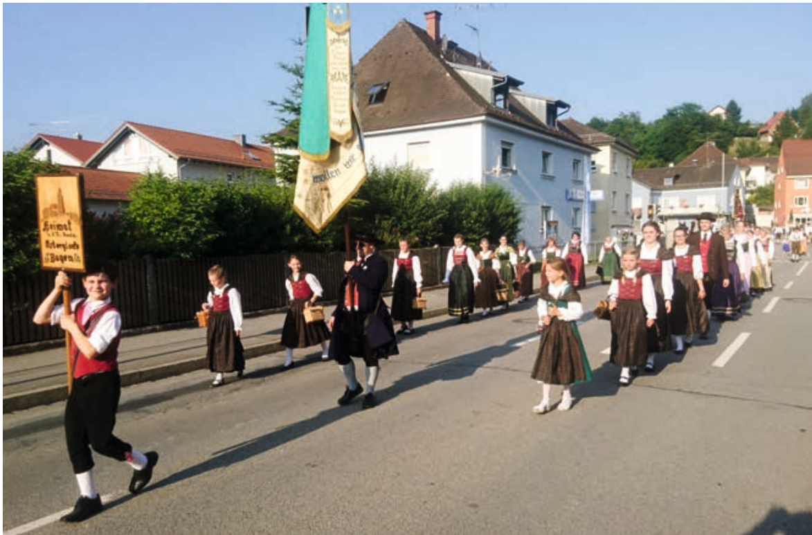
Ausmarsch zum Bogener Volksfest