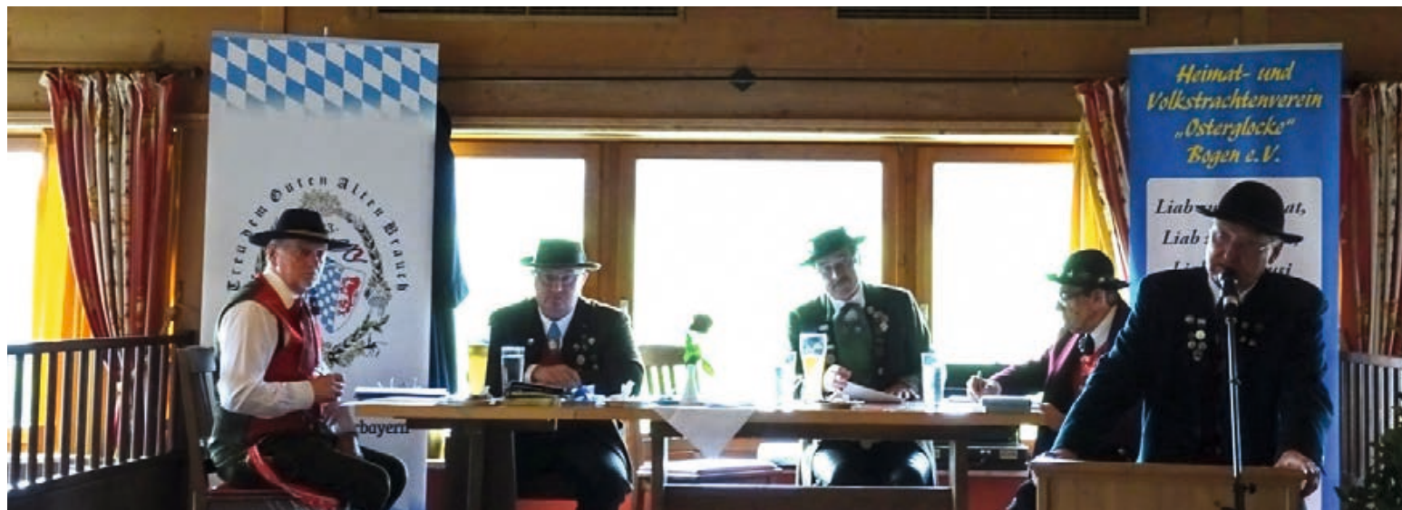
Vorständetagung des Trachtengau Niederbayern e.V. in Degernbach