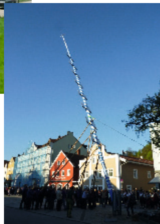
Der Bogener Maibaum: Umlegen alter Baum, Einholen, bemalen und aufstellen des neuen Baumes (Bilder von links nach rechts)