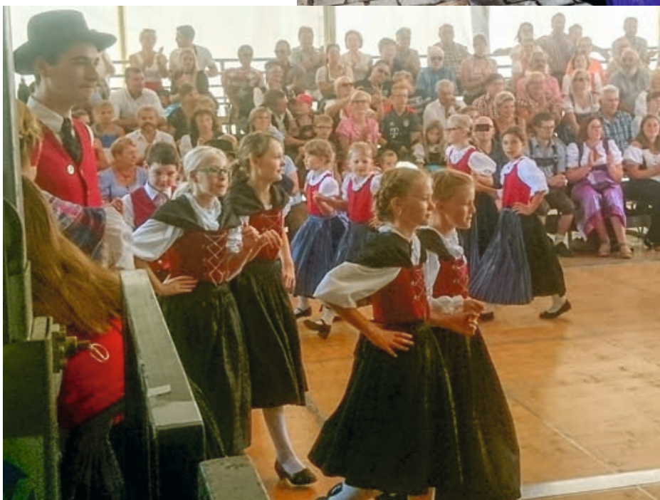
Auftritt Alte Wiesn Gäubodenvolksfest