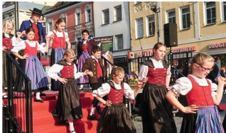
Auftritt der ArGe bei „Schlaflos – die lange Einkaufsnacht“ in Straubing 2017