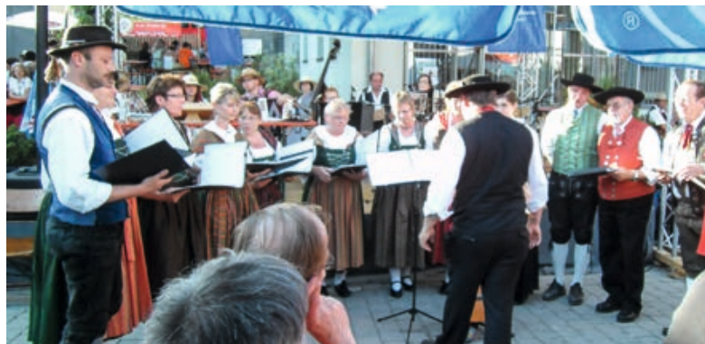
drumherum in Regen