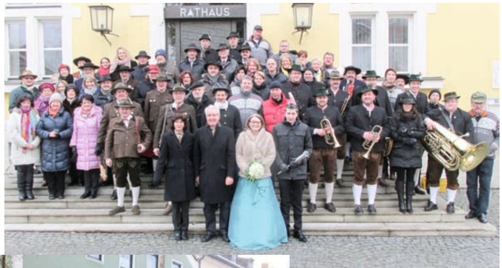
Neujahrsanschießen der Bogener Böllerschützen