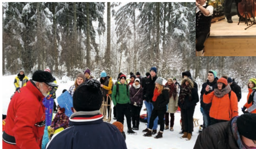
Drei-Gaue-Winterwanderung in Sankt Englmar