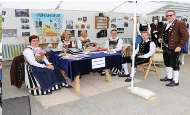
Regionaltag in Oberschneiding