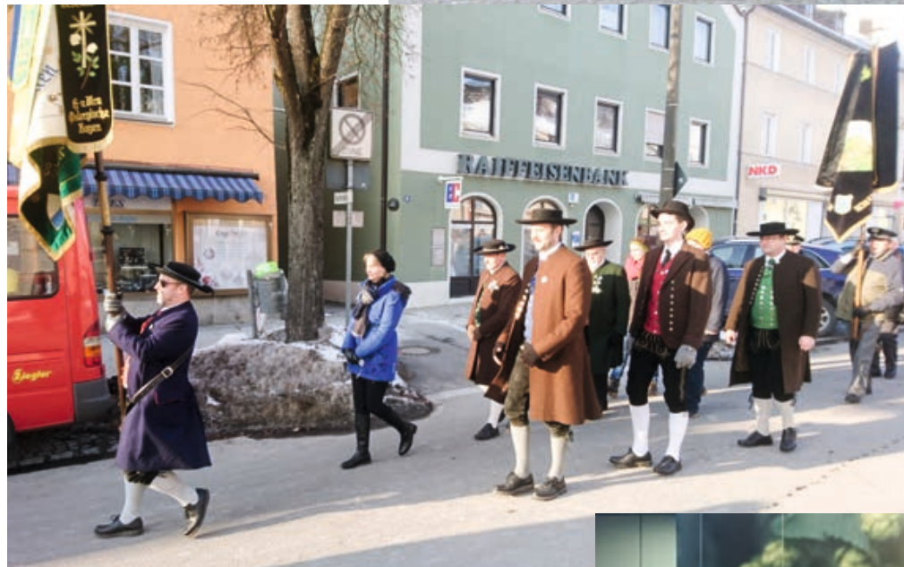
Sebastianifeier und -prozession der Pfarrei Bogen