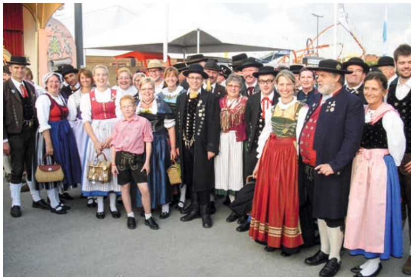
Auf der „Oidn Wiesn“ am Oktoberfest