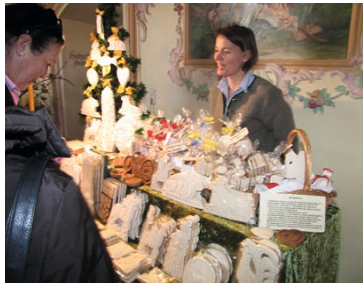
Trachten- und Kunsthandwerkermarkt mit Bogener Ostermarkt (Klostermarkt)