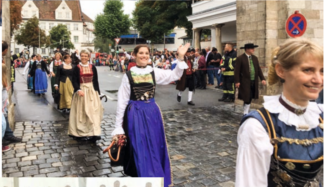
Ausmarsch zum Gäubodenvolksfest