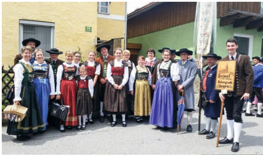
Drei-Gau-Trachtenfest in Bodenmais