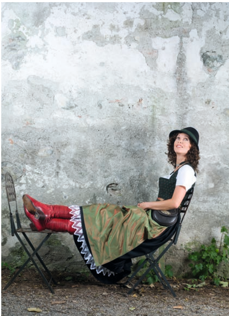
Dirndlgewand und Faltenstiefel, Kollektion 2008 (TIZ)