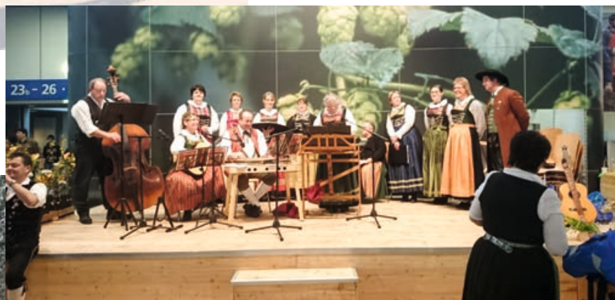
Auf der „Grünen Woche“ in Berlin