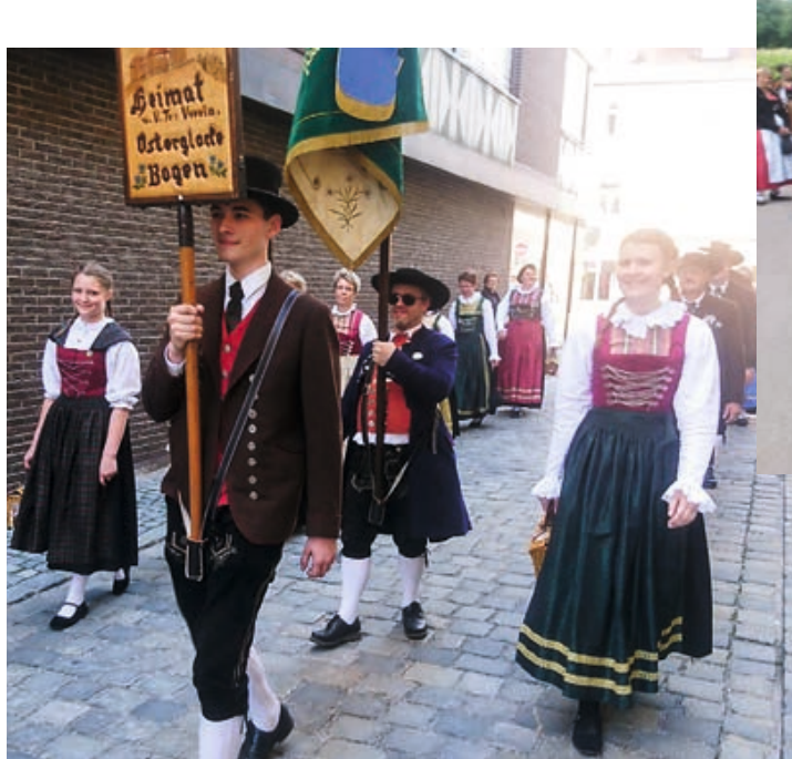
90-jähriges Gründungsfest „Immergrün“ Straubing