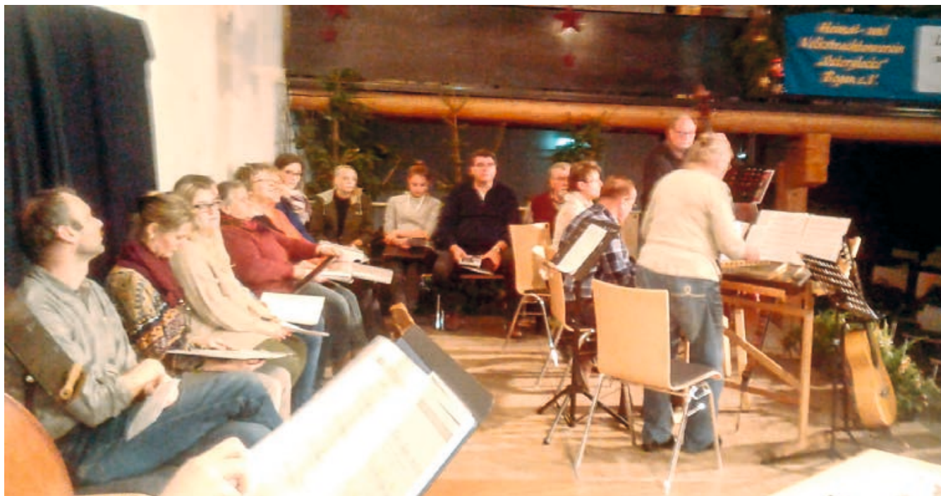
Proben für die Altbairische Weihnacht