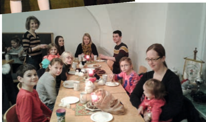
Jahresabschlussfeier der Kinder- und Jugendgruppe