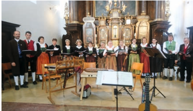
Mariensingen in der Schutzengelkirche in Straubing