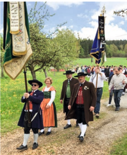
Trachtenwallfahrt in Elisabethzell