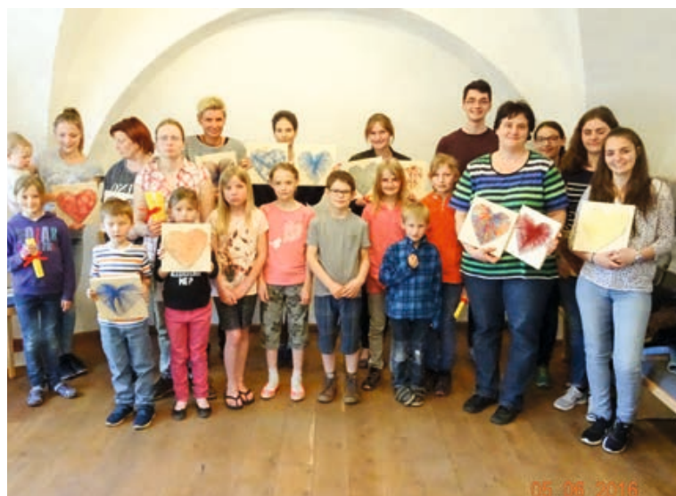
Muttertagsbasteln und -feier der Kinder- und Jugendgruppe