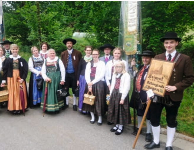
Gautrachtenfest in St. Englmar