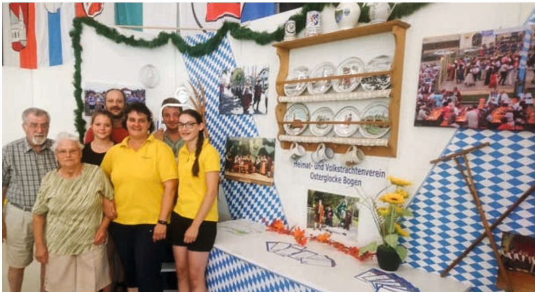
Informationsstand auf der Ostbayernschau