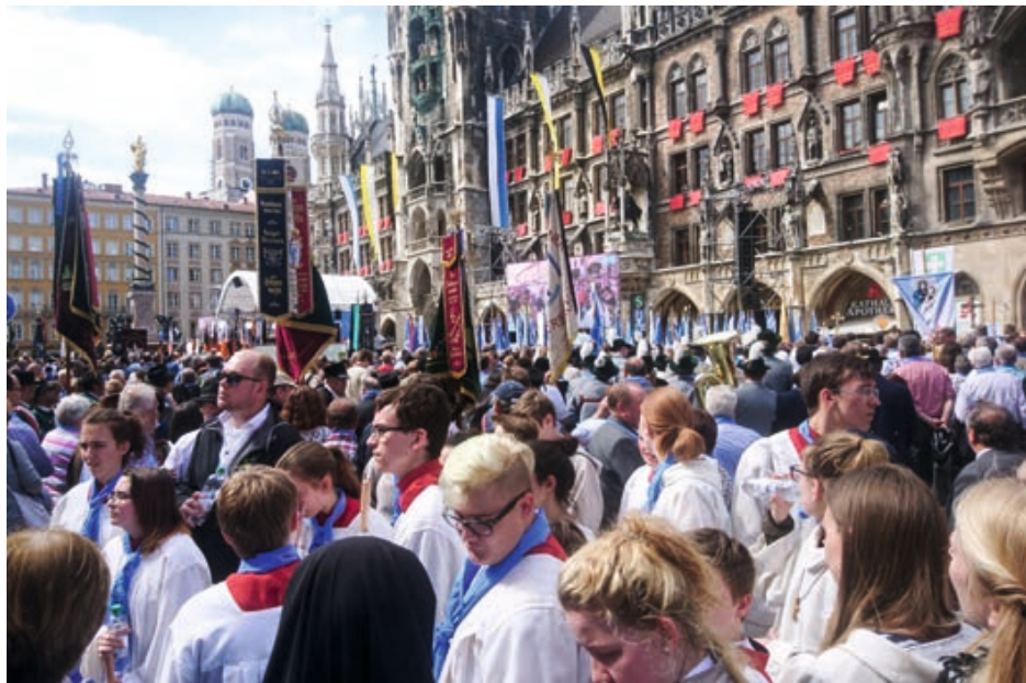
Sternwallfahrt 100 Jahre Patrona Bavariae in München