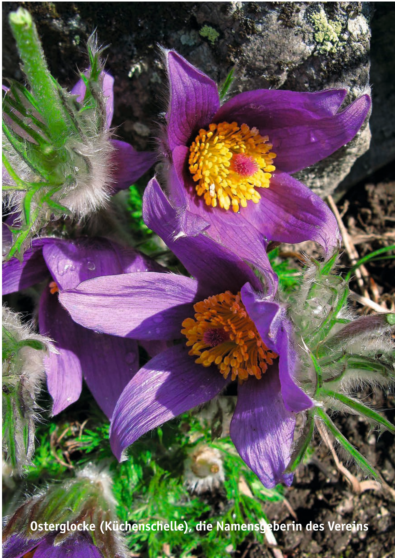
Osterglocke (Küchenschelle), die Namensgeberin des Vereins